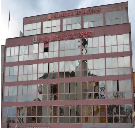
Hizmet Binası (1)