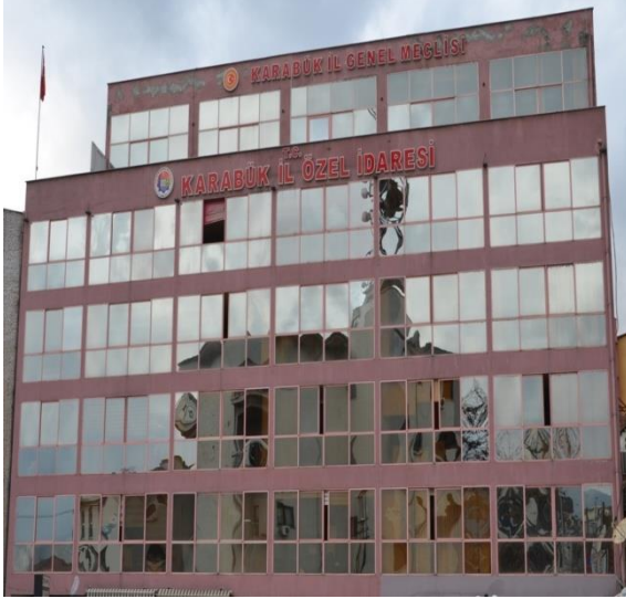
Eski Hizmet Binası